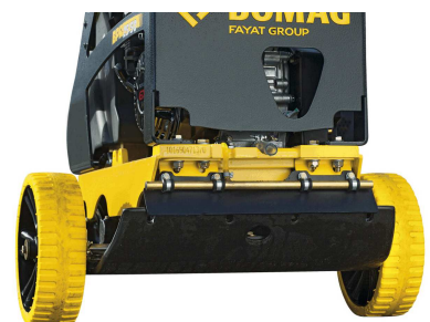
Einfacher und sicherer Transport Transporträder (optional)