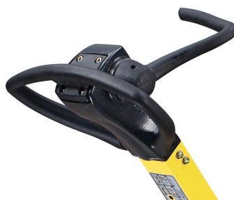
Präzise und sicher bedienbar BOMAG Ein-Hebel-Steuerung