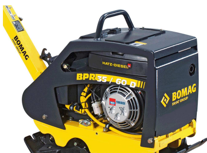
Robust und zuverlässig Bester Komponentenschutz